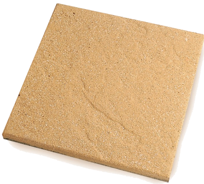
En 40x40x3.7 Ref: 470 En 50x50x5 Ref: En 50x50x4 Ref:

Le grenailage des dalles de cette série permet de faire ressortir l'éclat des pierres qui la constitue tout en les rendant très douce et antidérapante à la fois