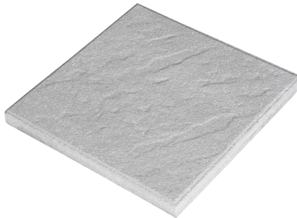
En 40x40x3.7 Ref: 476 En 50x50x5 Ref: En 50x50x4 Ref: