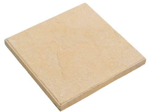
En 40x40x3.7 Ref: 479 En 50x50x5 Ref: En 50x50x4 Ref: